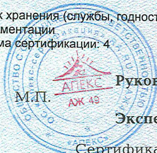
Схема сертификации: 4

Срок хранения (службы, годности) указан в прилагаемой к продукции товаросопроводительной и/или эксплуатационной документации.